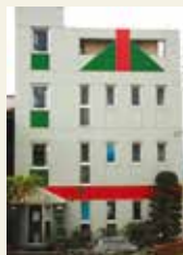
当校は学割指定校です 西鉄/地下鉄/JR九州