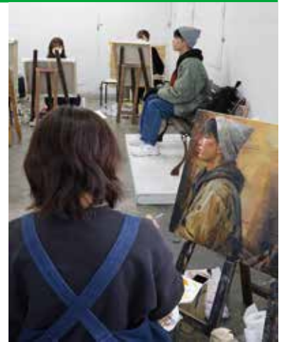
受講料/申込方法はP6をご覧ください

当校の講習会は昼間コースは課題単位、夜間コースは1週間単位でお申込が可能です。受講期間に応じて割引料金が設定されており、長期受講や昼間コース・夜間コースの併用受講は割引料金が適用されます。(当校塾生は別途、受講料を設定しています)